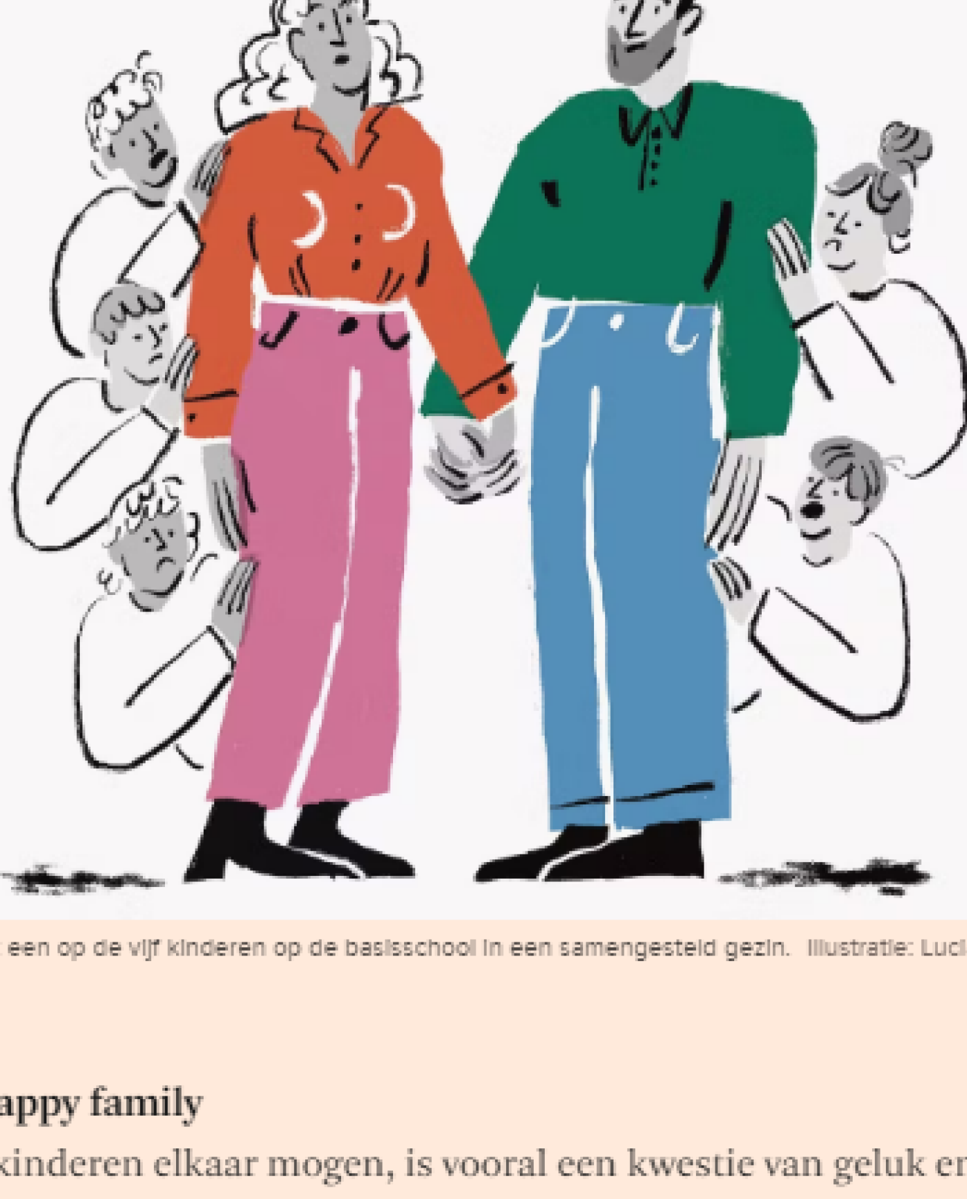
Gemiddeld leeft een op de vijf kinderen op de basisschool in een samengesteld gezin. Illustratie: Lucia Lenders voor het FD.

'Onze eigen kinderen zijn nu volwassen. Ik zie dat de relatie tussen de biologische broers en zus enorm sterk is. Als het erop aankomt zullen mijn zonen altijd voor elkaar strijden, net als de zoon en dochter van mijn man dat zullen doen. Maar onderschat ook zeker niet de band die ze met zijn vijven hebben. Ze hebben een eigen appgroep en gaan regelmatig samen stappen. Binnenkort gaan ze met zijn allen een dagje skiën in Duitsland. Ze vroegen ons wel mee, maar dat was meer voor de vorm. Ik denk dat ze in de loop van de tijd elkaars kwaliteiten meer zijn gaan waarderen. Ze zijn toch voor een deel samen opgegroeid en hebben veel meegemaakt. Tussen mijn middelste zoon en de dochter van mijn man is altijd een sterke klik geweest. Zij zijn dikke vrienden en kunnen alles tegen elkaar zeggen. Daar heb ik grote bewondering voor.'